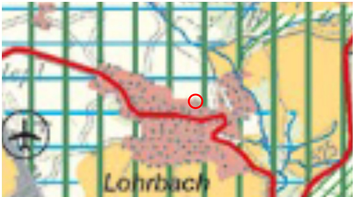
Abb. 3: Auszug aus der Raumnutzungskarte des Einheitlichen Regionalplans

In der Raumnutzungskarte ist das Plangebiet nachrichtlich als „Siedlungsfläche Wohnen“ (Bestand) dargestellt.