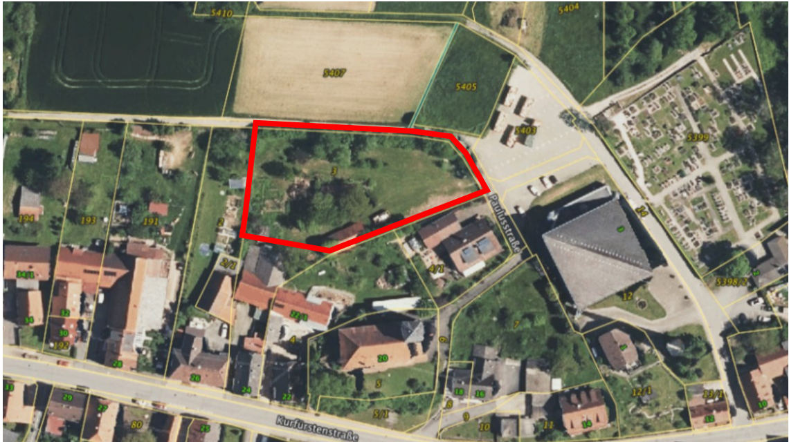
Abb. 2: Auszug aus dem Geoportal Baden-Württemberg

Der nördlich angrenzende Bereich wird zukünftig durch den in Aufstellung befindlichen Bebauungsplan "Hofäcker, Nr. 4.10" überplant sein. Statt der Ackernutzung werden dort weitere Baugrundstücke mit Wohnbebauung entstehen.